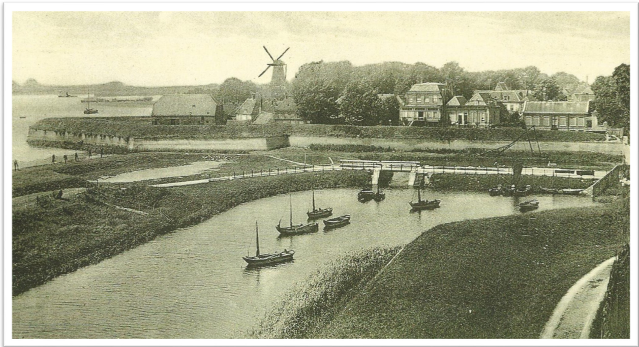
Gorinchem circa 1900-1910: Een mooi panorama vanuit de Dalemwal ter hoogte van Bastion VIII met zicht op de Altenawal.