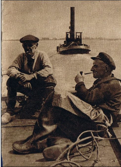
Even een ogenblikje rusten. De zalmvissers profiteren van de paar minuten rust, die zij genieten kunnen.

Als de vreugde over de gevangen zalm bedaard is, gaat de sleepboot er met het vlot al weer vandoor, om over enkele ogenblikken opnieuw met de stroom mee te varen en de netten voor een volgende keer uit te zetten. Wellicht is men dan zo gelukkig als een paar dagen geleden, toen er negen zalmen tegelijk gevangen werden. Dat was nog eens een dagje !