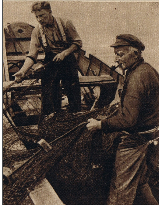
Het werk gaat weer beginnen. Het 400 meter lange net wordt in een roeibootje zorgvuldig weer ingeladen voor de volgende trek.

Over het algemeen brengen de zalmvissers, niet veel mee naar huis. Vaak beuren zij niet meer dan een hele gulden per week boven hun acht gulden steenuitkering. Soms worden het een paar guldentjes, maar de zeven gulden, die zij mogen verdienen, halen zij zo goed als nooit. De zalm wordt duur betaald!