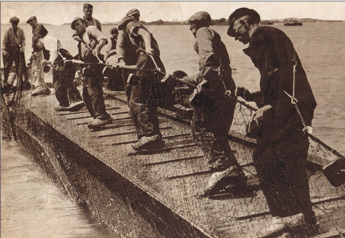
Stap voor stap, als Hollandse Wolgasleppers, trekken de mannen het net langzaam binnen boord.