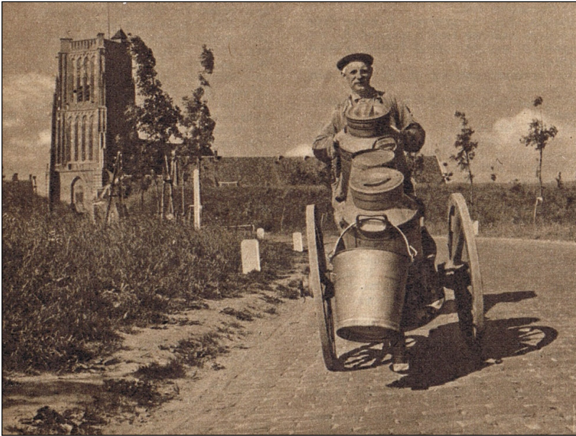
Wel Woudrichemmer, maar geen visser. Er moet boter bij de vis zijn en daarvoor zorgen de koeien van deze Brabantse boer, die weiden in de omgeving van het oude stedeke.