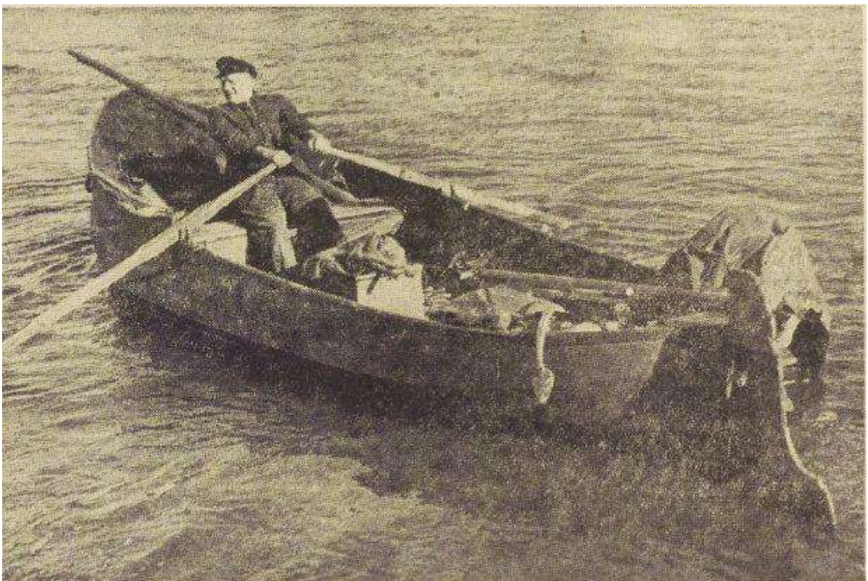
Vissersschouw van het oude type met als enige beschutting een zeildoeken huifje, maar nu toch wel met een aanhangmotor.

'Vroeger zat hier bar veel zalm'. 'We voeren met meer dan twintig boten tegelijk uit'. 'In 1892 vingten we op een dag tachtig zalmen van door elkaar twintig pond en vijfduizend elften'. 'Als de vissers na zo'n vangst gingen afrekenen, brak de tafel bekant van het geld en toch verdienden ze per man niet meer dan gemiddeld zeven of acht gulden in de week'. 'De visserij was hier zwaar overbevolkt'.